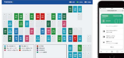
座席表・チェックイン

周りのスケジュールを素早く確認できるアプリ。メンバーの状況把握に役立っています。「アイコンの写真で名前と顔を覚えた」という副産物も。