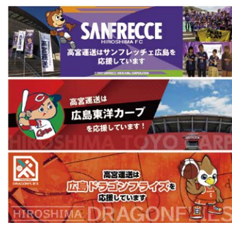
多くのプロスポーツを応援する地域に根付いた高宮運送