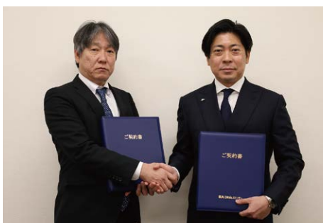
2024年2月14日、グループの仲間入りを果たしました。